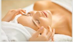
3.現役のエステティシャン講師が指導