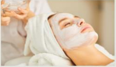
1.初心者でも基礎から学べるカリキュラム