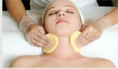
2.即戦力・対応力・接客力が身につく