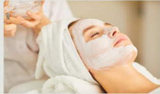
1.初心者でも基礎から学べるカリキュラム