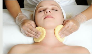
2.即戦力・対応力・接客力が身につく