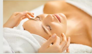
3.現役のエステティシャン講師が指導