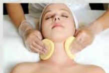
1.初心者でも基礎から学べるカリキュラム 2.即戦力・対応力・接客力が身につく